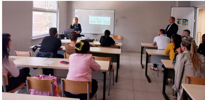
Departamenti i Drejtësisë, Universiteti Mesdhetar

LEKSIONE TE HAPURA, në kuadër të bashkëpunimit me 12 Klinikat e Ligjit, pranë Universiteteve të Arsimit të Lartë.