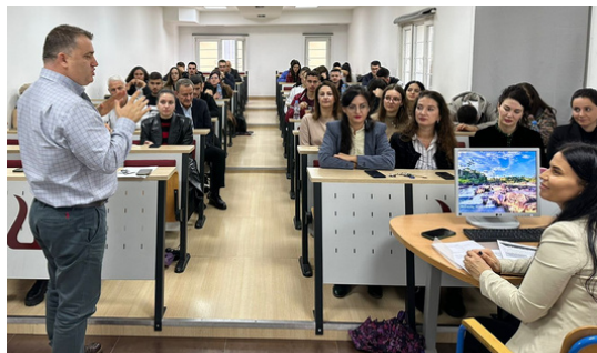
Departamenti i Drejtësisë, Universiteti Luarasi